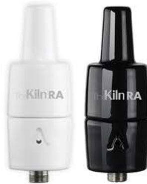
The Kiln RA Kit