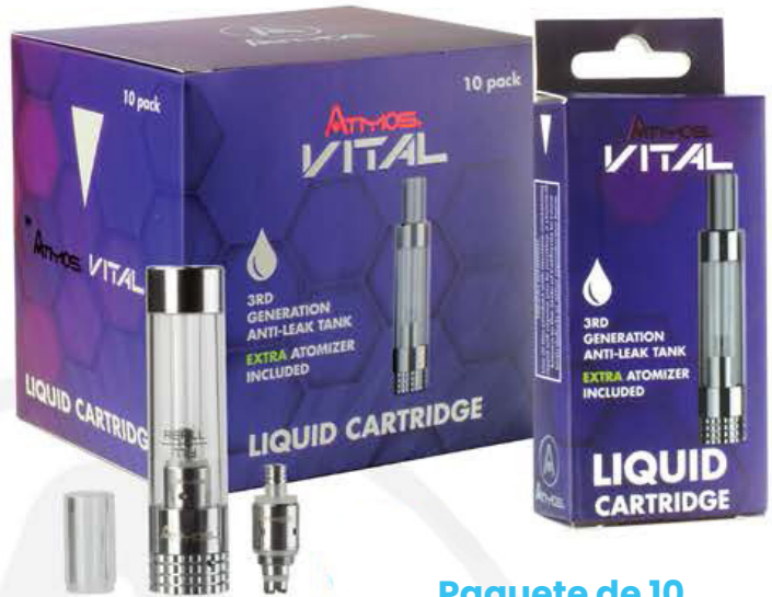
Paquete de 10 Cartuchos