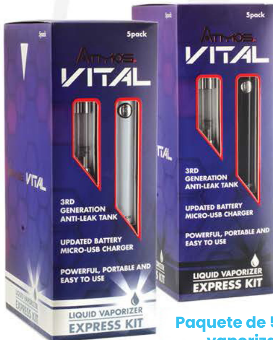
Paquete de 5 kits de vaporizador

donde la conveniencia cumple con la practicidad.