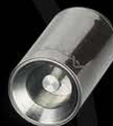
Clavo De Titanio