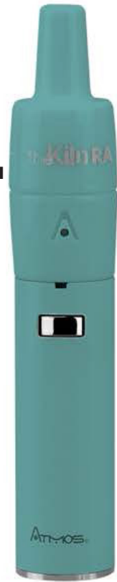
The Kiln RA Kit Disponible en