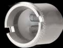
bobina de titanio doble