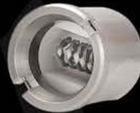
Bobina Kanthal Retorcida