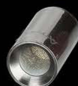
Incrustado Cerámico (Hierbas Secas)