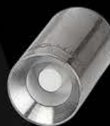
Clavo De Ceramica