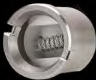
bobina acero inoxidable