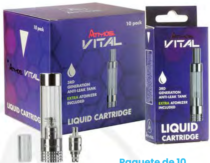
Paquete de 10 Cartuchos