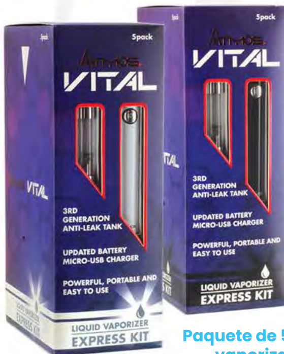
Paquete de 5 kits de vaporizador

donde la conveniencia cumple con la practicidad.