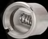
Bobina Kanthal Retorcida