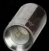
Incrustado Cerámico (Hierbas Secas)