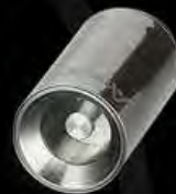
Clavo De Titanio