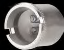
bobina de titanio doble