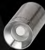
Clavo De Ceramica