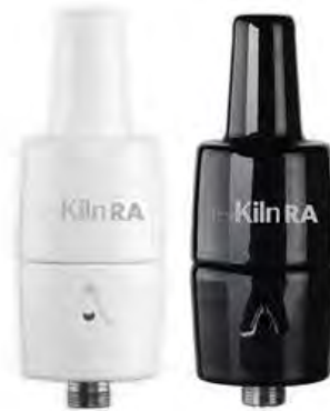
The Kiln RA Kit