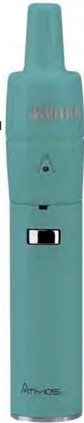
The Kiln RA Kit Disponible en